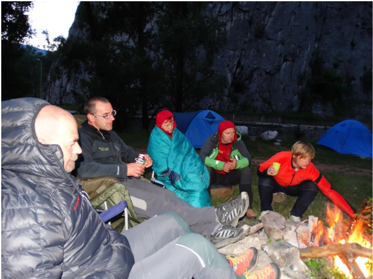
Večeri ob ognju, takšnem ali drugačnem